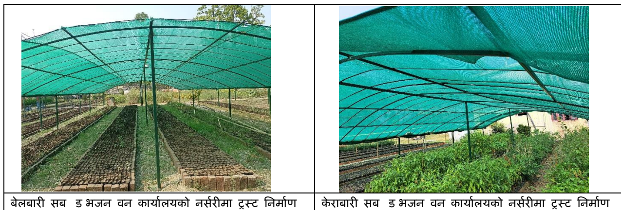
बेलबारी सब डिभिजन वन कार्यालयको नर्सरीमा ट्रस्ट निर्माण

यस अवधिमा यस जिल्लामा बेलबारी र केराबारी सब डिभिजन वन कार्यालयको कम्पाउण्डमा रहेको नर्सरीमा ट्रस्ट निर्माणको कार्य सम्पन्न भएको छ ।