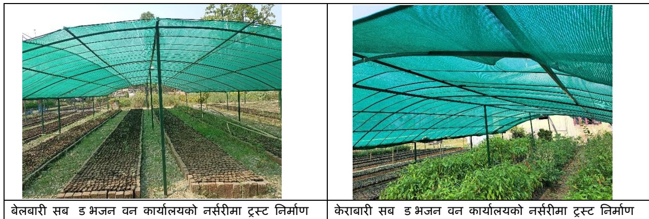
बेलबारी सब डिभिजन वन कार्यालयको नर्सरीमा ट्रस्ट निर्माण

यस अवधिमा यस जिल्लामा बेलबारी र केराबारी सब डिभिजन वन कार्यालयको कम्पाउण्डमा रहेको नर्सरीमा ट्रस्ट निर्माणको कार्य सम्पन्न भएको छ ।